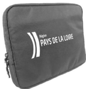
Housse de protection