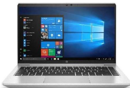
HP PRO 440 G8